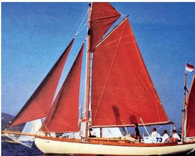
Molly dorénavant amarré à la Darse

Ce programme dont l'objectif est de faire des ports départementaux de Villefranche un pôle de référence national vise à atteindre dans les prochaines années 50 bateaux en bois soit 10 % des places du port royal de la Darse. La commission a retenu un magnifique pointu à voile latine et un ketch de 1914 classé Bateau d'Intérêt Patrimonial. Ces navires chargés d'histoire constituent une vitrine en parfaite adéquation avec l'esprit du port royal de la Darse et confortent l'activité des charpentiers de marine et menuisiers.