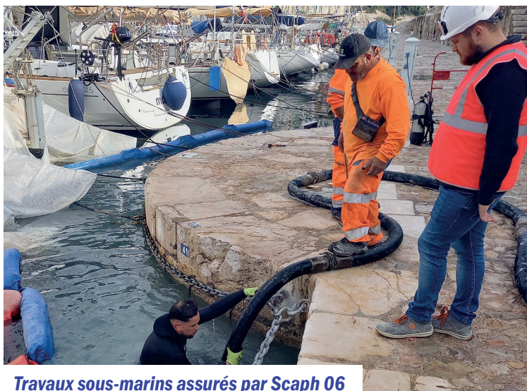
Travaux sous-marins assurés par Scaph 06

Les travaux de rénovation du quai de la jetée ont repris début octobre après la saison estivale. Rappelons que ce sont l'équivalent de 3 terrains de tennis soit 1440 m 2 qui sont recouverts de moellons de pierre et lignes directrices en pierre de taille, restituant ainsi le caractère patrimonial de cet ouvrage historique datant de 1726. À la différence de la première phase, le déplacement des réseaux (électrique, fibre optique et caméra) a constitué une étape délicate. L'esprit général de l'opération étant de restituer l'ouvrage tel qu'il était au XVIII e siècle, les réseaux ont été enfouis. La fin des travaux est prévue pour la fin du mois de janvier 2026 et offrira aux plaisanciers et visiteurs une restitution fidèle des quais.